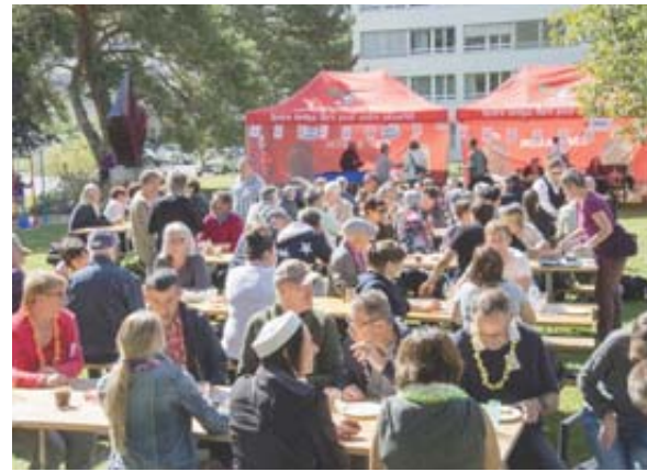
14 HEURES Beau succès populaire pour la 25 e kermesse de la FOVAHM qui a fait le plein de bonheur.