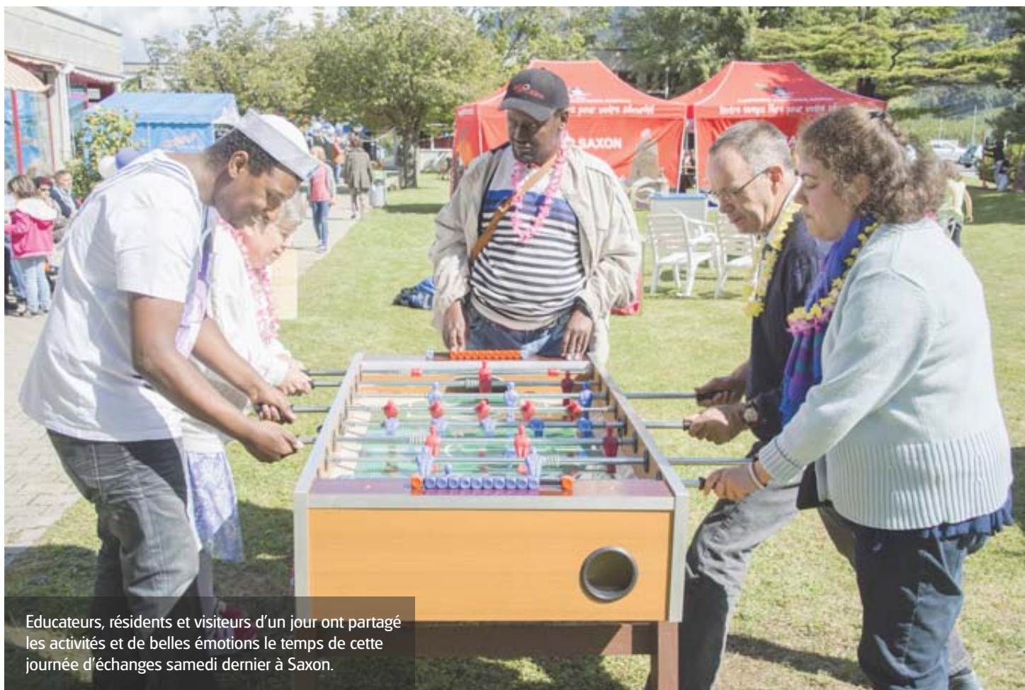
Educateurs, résidents et visiteurs d'un jour ont partagé les activités et de belles émotions le temps de cette journée d'échanges samedi dernier à Saxon.

«Lancée en 1990, la manifestation a vécu cinq premières éditions plutôt repliées sur elle-même, se souvient le directeur entré en fonction en... 1990. Il y avait là uniquement nos pensionnaires, leurs familles et l'encadrement.» En 1995, le Home-Ateliers de la Pierre-à-Voir choisit de s'ouvrir un peu plus vers l'extérieur. «Attention, l'institution n'a jamais vécu totalement fermée sur elle-même. Elle avait cherché depuis longtemps à ouvrir ses portes aux Saxonnains. Notamment en mettant à disposition de la communauté sa piscine ce qui a permis à des centaines d'enfants non seulement de s'initier à la natation,