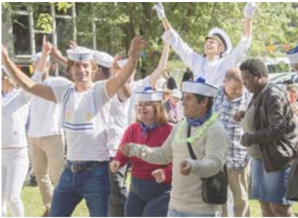
11 H 30 La croisière commence à s'amuser et les éducateurs reçoivent en dansant leurs premiers invités.