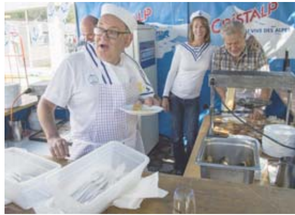
13 HEURES Le coup de feu. Pensionnaires et éducateurs donnent un coup de main au président de la Concordia.